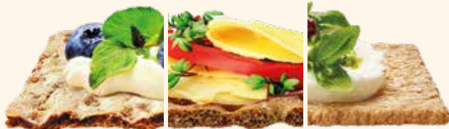
MILCH & JOGHURT