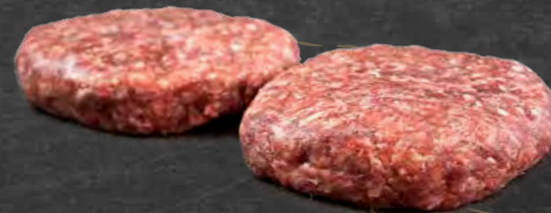
BURGER PATTIES 30 X 180 G