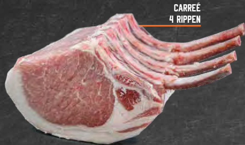
CARREÉ 4 RIPPEN