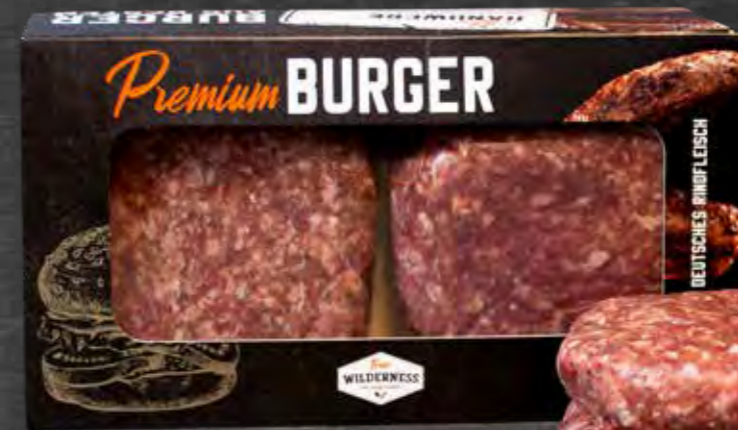
BURGER-PATTIES 4 X 180 G FRISCH