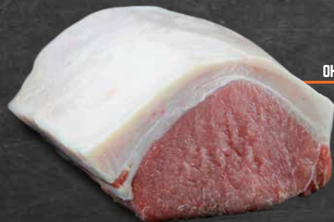
RÜCKEN OHNE KNOCHEN